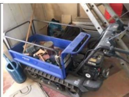
Brouette motorisée mise à disposition des livreurs