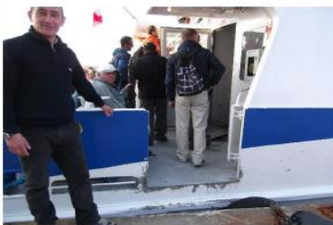
Accès au bateau

❌ Lieu de stockage des colis en attendant le chargement dans la nacelle